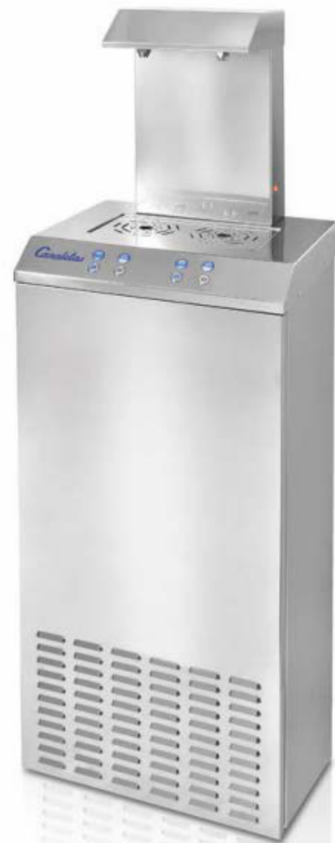
Modèle GC-10A 4P

Quatre boutons: eau froide, ambiante et mixte.