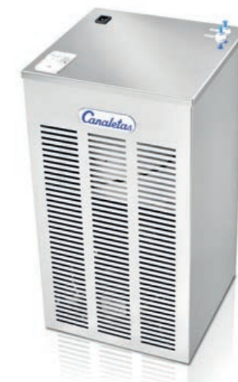
Equipo de frío

Catálogo específico para el equipo de frío (Serie GF).