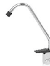
Grifo Estándar (incluido en el Minicool)